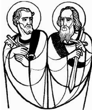
Hl. Petrus und hl. Paulus bittet für uns!